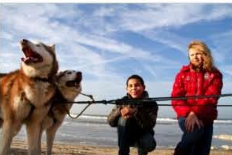
Sleehonden op het Scheveningse strand

Het boek Ijsbarbaar van Rob Ruggenberg ligt vanaf vandaag in de boekhandel.