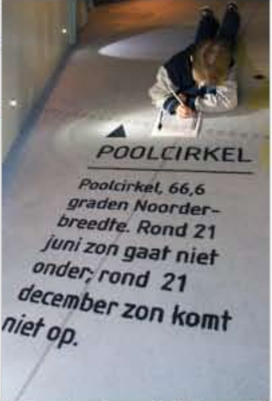
Een leerling is aandachtig aan het schrijven

Voordat het zover is komt er een kleine pauze. Volgens Ella het één na