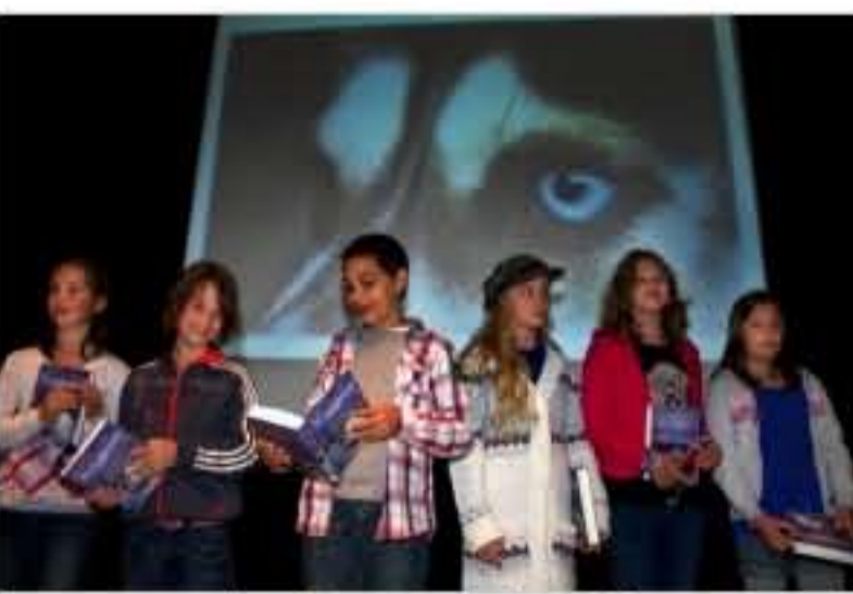
Top zes van de schrijverswedstrijd

Na de film die vertoond wordt kunnen de kinderen eerst vragen stellen aan de schrijver van het boek en zal de prijs voor de creatiefste schrijver uitgereikt worden. De kinderen hebben gelukkig veel vragen, want de jury heeft het heel moeilijk met het bepalen van de winnaar. De verhalen van de Duinoordschool waren volgens de jury allemaal heel erg goed, maar uiteindelijk vonden ze de verhalen van zes kinderen het allermooiste. Van deze zes mogen er uiteindelijk twee kinderen mee met de slee.