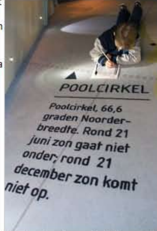
Een leerling is aandachtig aan het schrijven

Voordat het zover is komt er een kleine pauze. Volgens Ella het één na