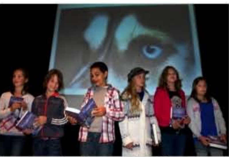
Top zes van de schrijverswedstrijd

Na de film die vertoond wordt kunnen de kinderen eerst vragen stellen aan de schrijver van het boek en zal de prijs voor de creatiefste schrijver uitgereikt worden. De kinderen hebben gelukkig veel vragen, want de jury heeft het heel moeilijk met het bepalen van de winnaar. De verhalen van de Duinoordschool waren volgens de jury allemaal heel erg goed, maar uiteindelijk vonden ze de verhalen van zes kinderen het allermooiste. Van deze zes mogen er uiteindelijk twee kinderen mee met de slee.