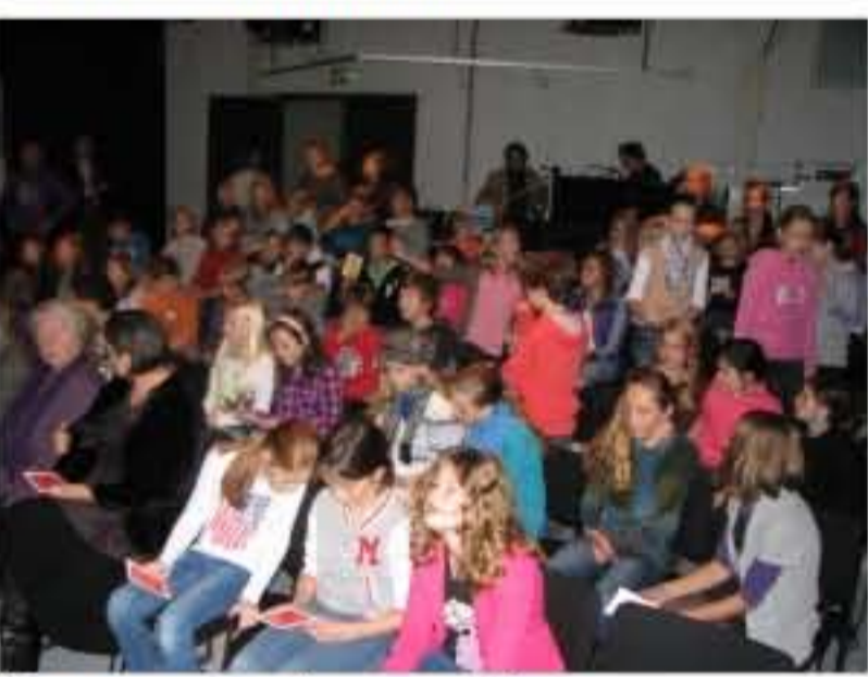
Gespannen voor de presentatie