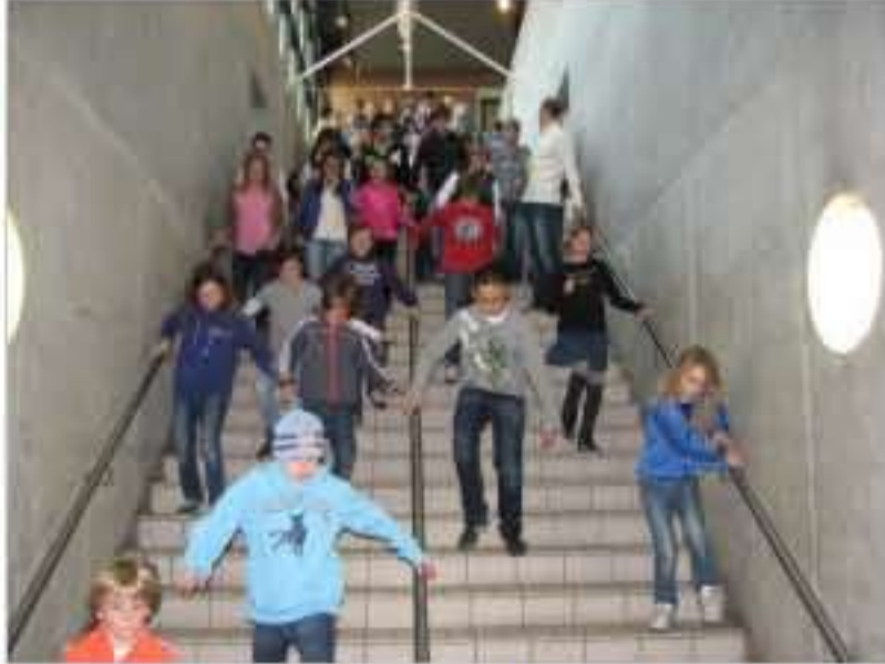
Kinderen van de Duinoordschool komen de trap af stormen