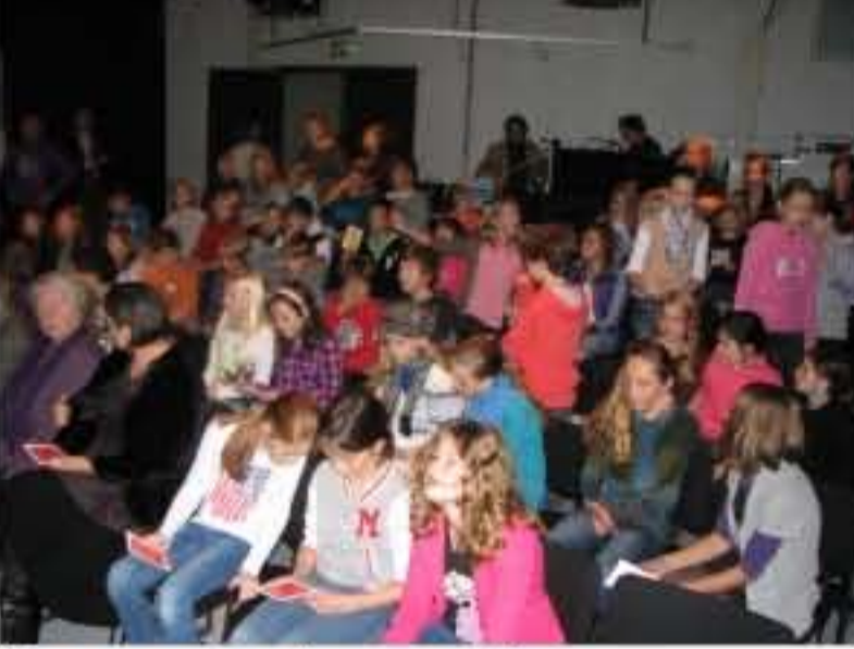
Gespannen voor de presentatie

Er volgt een kleine les van het Museon over de naamgeving van Groenland, een naam die stamt uit de tijd van Eric de Roode, de woeste viking uit IJsland. Daarna verteld Rob Ruggenberg nog een verhaal uit het boek. Zo vervolgt de cyclus, met een informatief stuk over de tweeduimige arm en daarna een stukje uit het boek, over Nunôk, de hoofdpersoon uit het boek, die poepjongen werd.