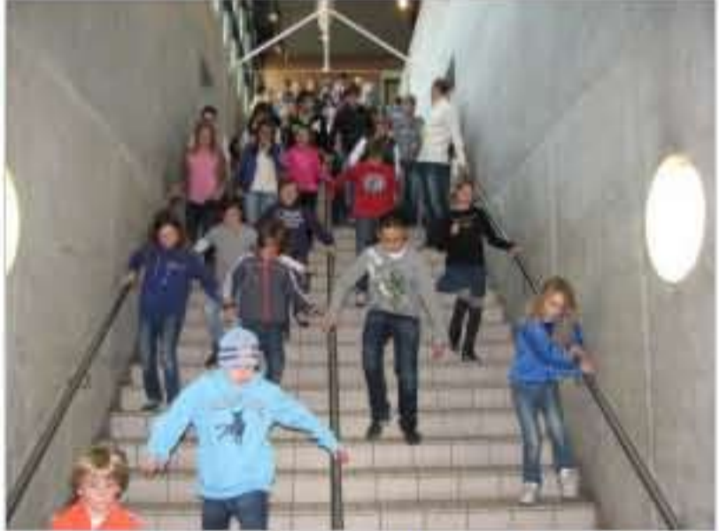
Kinderen van de Duinoordschool komen de trap af stormen