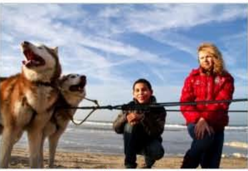
Sleehonden op het Scheveningse strand

Het boek Ijsbarbaar van Rob Ruggenberg ligt vanaf vandaag in de boekhandel.